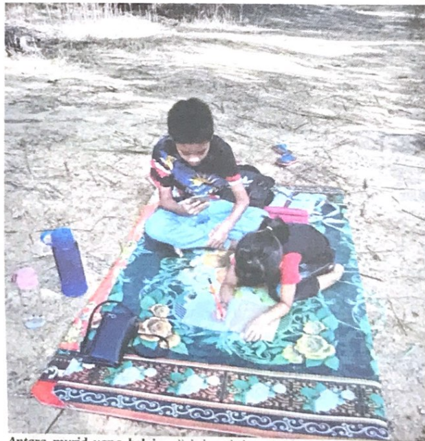
Antara murid yang belajar di kebun kelapa sawit di Kampung Tamok, Segamat akibat tiada capaian internet di rumah mereka yang terletak berbelas kilometer dari lokasi.