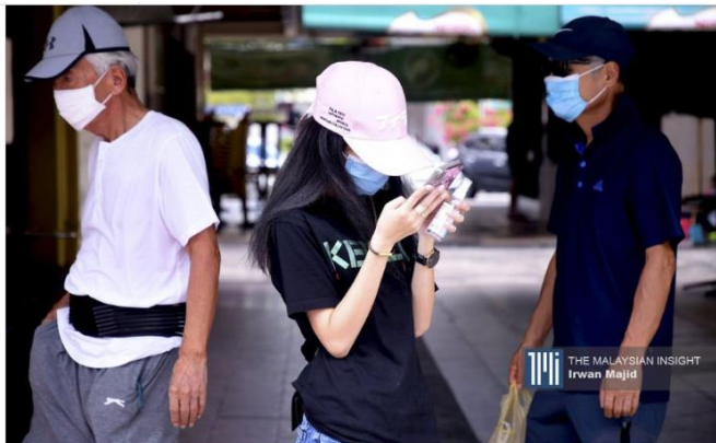
MySejahtera dikembangkan oleh kerajaan Malaysia untuk membantu memantau wabak Covid-19 dengan membenarkan pengguna untuk menilai risiko kesihatan mereka.

Dikemas kini 1 minggu yang lalu · Diterbitkan pada 13 Jul 2020 11:48AM · 0 Komen