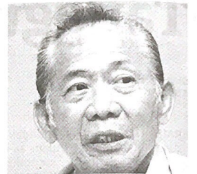
MENDIANG DR. KHOO KAY KIM

Sistem yang diwujudkan oleh perkhidmatan awam tidak harus dikenakan kepada orang-orang seperti hakim, profesor dan pensyarah demi mewujudkan peneluran idea lebih berani dan spon-