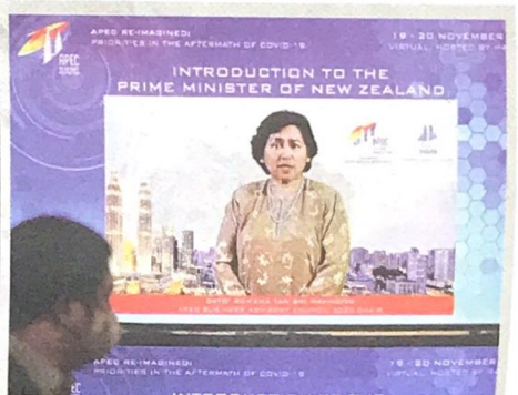
APEC berusaha menambah baik infrastruktur negara masing-masing bagi memberi peluang wanita menceburkan diri dalam bidang e-perniagaan.