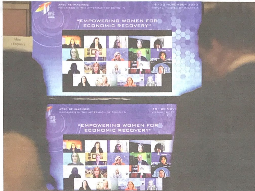
APEC menjadi medan perbincangan mempersiapkan wanita berdepan perubahan norma baharu kesan penularan pandemik COVID-19.

Kisah benar penjual bunga wanita ini di antara ribuan peniaga yang terkesan dengan Perintah