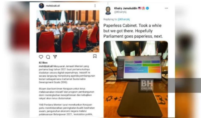
Mesyuarat Jemaah Menteri yang pertama pada tahun ini diadakan secara digital tanpa kertas.

KUALA LUMPUR: Mesyuarat Jemaah Menteri yang pertama tahun ini mencatat sejarah tersendiri apabila berlangsung secara digital sepenuhnya.