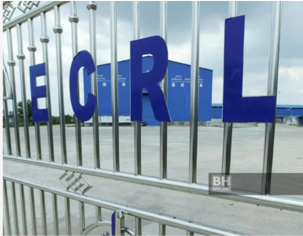
Projek Laluan Rel Pantai Timur (ECRL) sudah 19.69 peratus disiapkan

KUALA LUMPUR: Nilai kontrak kerja Projek Laluan Rel Pantai Timur (ECRL) yang diberikan kepada syarikat tempatan sejak pelaksanaannya dari 2017 hingga November 2020 mencecah RM3.39 bilion.