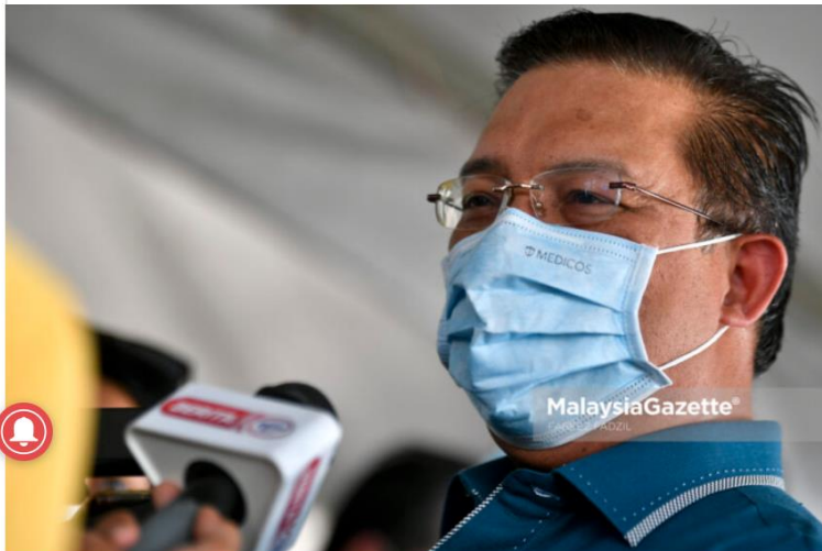
Ketua Setiausaha Negara, Tan Sri Mohd Zuki Ali bercakap kepada media selepas Perasmian Koperasi Kobuniti Selangor Berhad di Tapak Kebun Koperasi Kobuniti, Shah Alam.

SHAH ALAM – Kerajaan masih belum melakukan sebarang semakan semula terhadap skim persaraan penjawat awam susulan kenaikan kos dan kekangan kewangan negara.