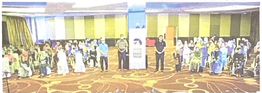
UMP Advanced dengan kerjasama ECERDC menjayakan program transformasi usahawan empower ke arah formalisasi dan digitalisasi.

"Bagaimanapun, kebanyakan usahawan empower tidak melepasi syarat bagi melayakkan mendapat manfaat itu, antaranya tidak aktif