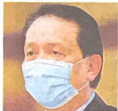
Dr Noor Hisham Abdullah

"Kita perlu ramai-ramai mendaftar untuk mendapat suntikan menerusi aplikasi MySejahtera. Saya sudah ada (aplikasi itu) dalam telefon (pintar). Semua data, maklumat yang terima semalam, saya terima dos pertama dan dapat