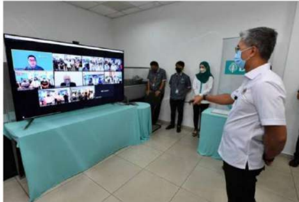
Perdana Menteri Datuk Seri Ismail Sabri Yaakob mengadakan pertemuan secara maya bersama Menteri Kewangan Tengku Datuk Seri Zafrul Abdul Aziz yang hadir ke Bank Simpanan Nasional (BSN) cawangan Putrajaya bagi meninjau situasi semasa hari pertama pembayaran Bantuan Khas Covid-19 (BKC) kepada para penerima hari ini.

PUTRAJAYA - [DIKEMAS KINI] Ketika pembayaran Bantuan Khas Covid-19 (BKC) mula disalurkan pada Isnin, Perdana Menteri, Datuk Seri Ismail Sabri Yaakob berkata, lebih banyak bantuan akan disalurkan kerajaan kepada rakyat bermula bulan depan.