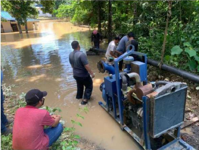
Kakitangan Jabatan Pengairan dan Saliran (JPS) Pahang menggunakan pam untuk mengeringkan air termenung berikutan kejadian banjir.

KUANTAN: Jabatan Pengairan dan Saliran (JPS) Pahang menggunakan lebih 10 unit pam yang digunakan untuk menyedut air yang bertakung susulan kejadian banjir di negeri ini.