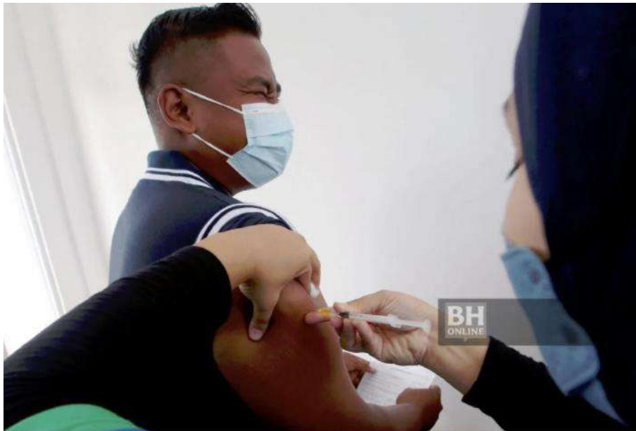
Antara yang hadir mendapatkan dos penggalak vaksin COVID-19 sempena Program Outreach Pemberian Vaksin di Sekolah Agama Rakyat Al-Saadah Penaga di Kepala Batas, semalam.

KUALA LUMPUR: Sebanyak 22,855,374 individu atau 97.6 peratus populasi dewasa di negara ini lengkap menerima suntikan vaksin COVID-19, setakat 11.59 malam tadi.