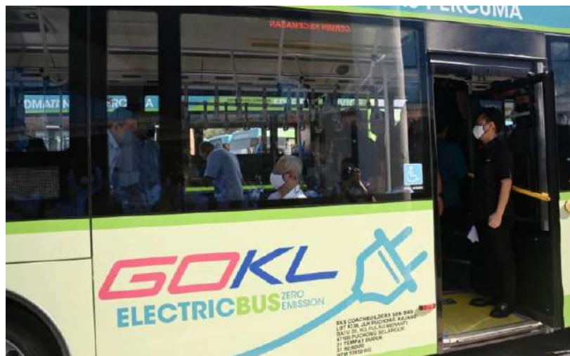
Ismail Sabri (tengah) menaiki bas elektrik penuh (EV) pada lawatan ke kilang pemasangan bas SKSBus Coachduilder, hari ini.