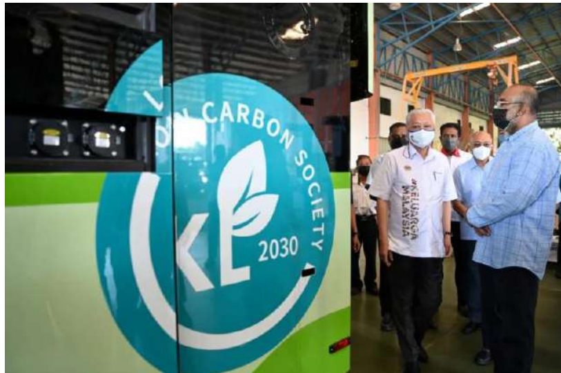
Ismail Sabri melawat kilang pemasangan bas elektrik penuh (EV) pada lawatan ke kilang pemasangan bas SKSBus Coachbuilder, hari ini.

Kumpulan SKSBus melalui unitnya SKS Coachbuilders Sdn Bhd mempunyai pengalaman lebih 50 tahun dalam industri pembinaan bas. Ia antara pengilang bas di Malaysia dengan pengesahan sebagai Barangan Buatan Malaysia dan dilengkapi dengan bantuan kilang robotik.