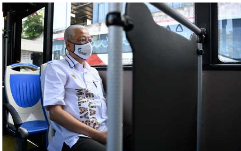
Ismail Sabri menaiki bas elektrik penuh (EV) pada lawatan ke kilang pemasangan bas SKSBus Coachduilder, hari ini.