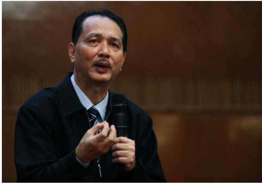
Ketua Pengarah Kesihatan, Tan Sri Noor Hisham Abdullah

Mengenai hasil surveilans COVID-19 di lokasi sentinel seluruh negara pada ME 24/2022, Dr Noor Hisham mendapati, kadar positif sampel kes Penyakit Seperti Influenza (ILI) bagi COVID-19 menurun 28.6 peratus iaitu 8.4 peratus pada ME 23/2022 kepada enam peratus pada ME 24/2022.